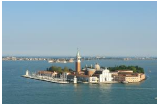
San Giorgio Maggiore