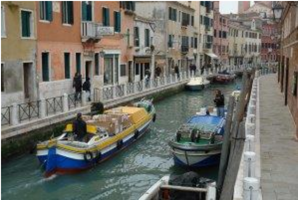
Kleine Kanäle und Gassen