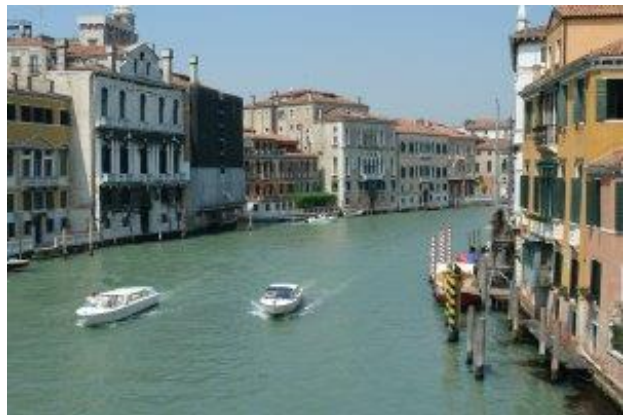
Canal Grande mit Wassertaxi