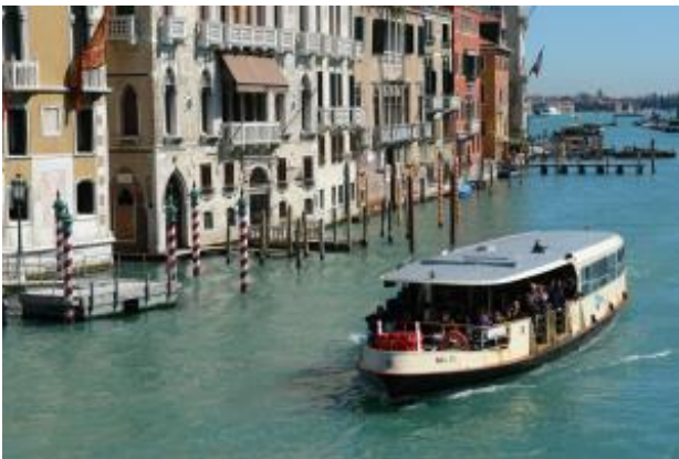
Canal Grande mit Vaporetto