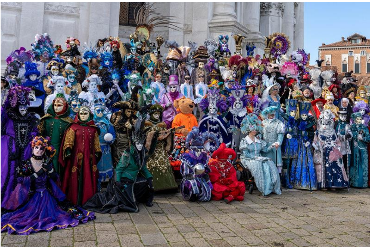
Die Masken vor der Kirche La Salute.

„Il tempo di Casanova“ (Das Zeitalter von Casanova).