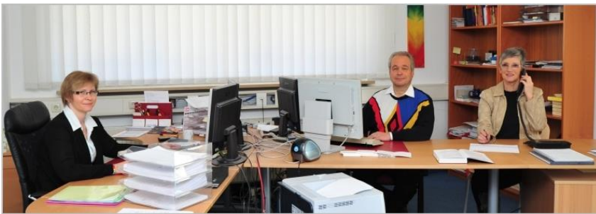
Das Team von Venedig.com www.venedig.com – info@venedig.com

Dieser Reiseführer ist kostenlos und darf für private Zwecke beliebig verwendet und kopiert und weitergegeben werden.