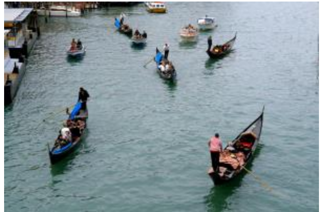
Canal Grande mit Gondeln

Insellage Wie Sie sicher schon gehört haben, ist Venedig eine Ansammlung von vielen kleinen Inseln, die mitten in der Lagune der nördliche Adria liegen.